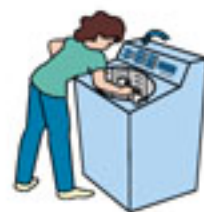
特室 ユニットバス付き